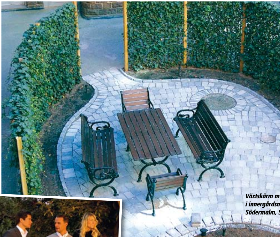
Växtskärm med murgröna i innergårdsmiljö på Södermalm, Stockholm.

De flesta innergårdar har mycket rymd på grund av höga husväggar. Med hjälp av ett enkelt pergolatak över exempelvis samlingsplatsen skapas en intimare och tryggare atmosfär. Klä gärna in med klängande växter för att få en känsla av grön skogsoas.