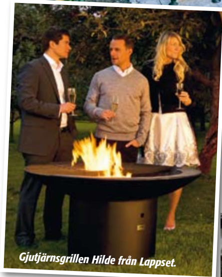
Gjutjärnsgrillen Hilde från Lappset.