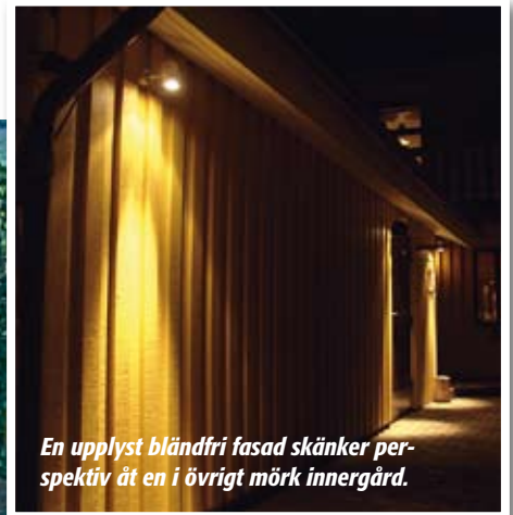
En upplyst bländfri fasad skänker perspektiv åt en i övrigt mörk innergård.

Flera ljuskällor är a och o. Många gårdar har dåligt ljus och ofta bara ett enda. Infälld belysning i stenbeläggningar och rabatter är ett smart sätt att skapa stämningsfull belysning. Eller varför inte lysa upp ett speciellt träd eller en skulptur?